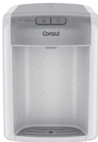
Purificador de Água Consul